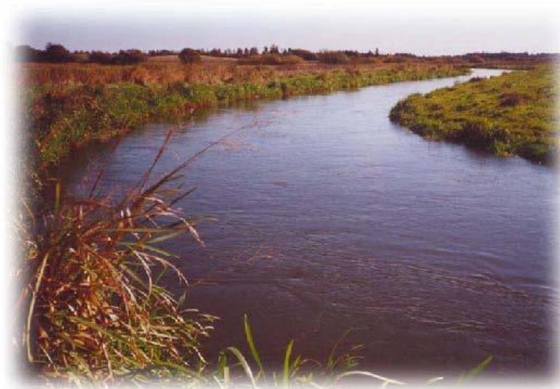
Grønbæks Store Høl, som er 3,85 m dyb

Udsigt over Karup Å, som giver en fascinerende stemning, uanset om det er forår, sommer eller efterår. Området er et eldorado for lystfiskere, som kommer år efter år. Åen er kendt for sin rige fiskebestand af havørreder.