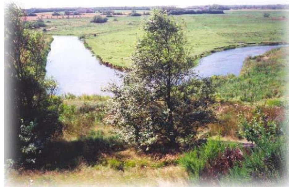
Et af de store sving med bagvand

Om natten søger den ud i åen. Havørreden er naturligvis meget sky og følsom overfor lyd og bevægelser både i vandet og på