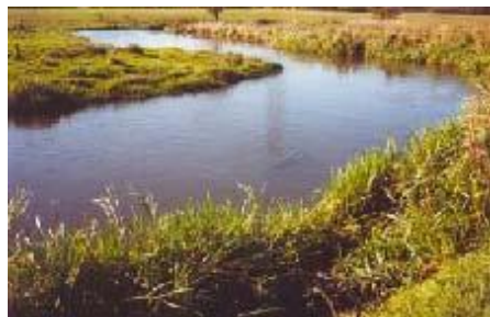
Grønbæks Lille Høl

På den 1,3 km. Lange åstrækning findes ”Grønbæks Lille Høl”. Som har en åbredde på 19 m. og en dybde på 2,80 m. i svinget. Der er grovgrus på bunden af svinget.