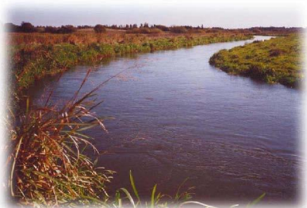
Grønbæks lille høl

1,3 km. Fiskeret som omfatter 8 store sving i åen – bl.a. ”Grønbæks Store Høl”, ”Grønbæks Lille Høl” og ”Slagter høl”. Yderligere fiskeret kan erhverves hos Højbjerg Super i Hagebro for ca. 100,- DDK. pr. dag. (2002 priser).